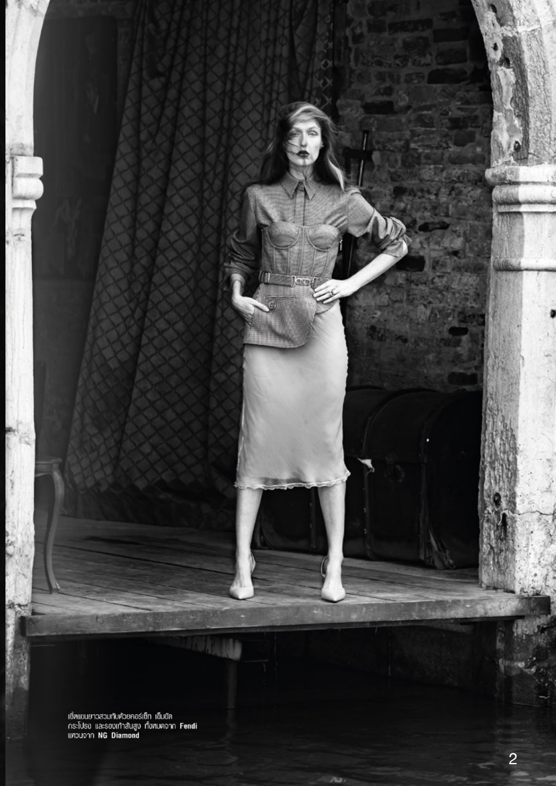
เซ็ทแฟชั่นสาวสวนทิวด้วยคอร์เซ็ท เป็นชุด กระโปรง และรองเท้าส้นสูง ทั้งหมดจาก Fendi แหวนจาก NG Diamond